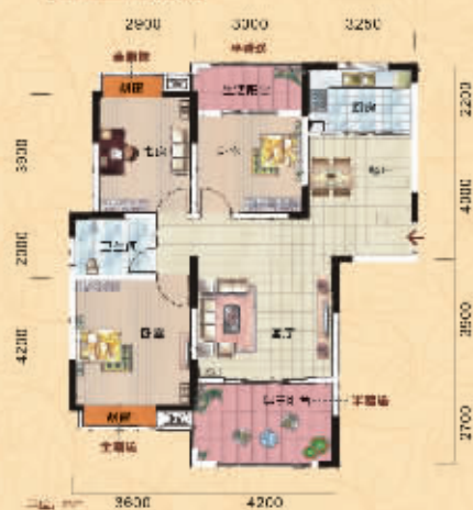
A1 香韵阁 建筑面积：82.85 m 2