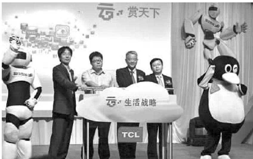
8月28日，全球著名彩电企业TCL在广州举办“云·赏天下——TCL全球‘云生活’”战略暨云电视发布会。

TCL超级智能云电视将于9月2日全球同步上市，当天下午4点，湖南苏宁37家门店可买到，购TCL指定机型还有TCL大礼包赠送。