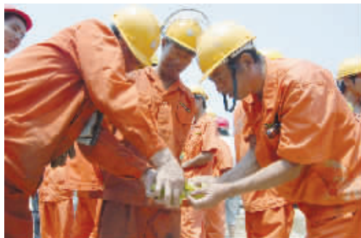
工人们分享三湘都市报工作人员送的青提。