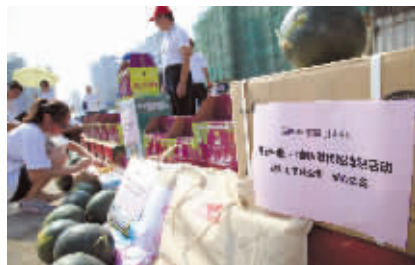
爱心物资在工地上摆了一长溜。