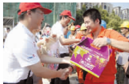
安利湖南省分公司的志愿者把爱心物资送给工人。

这些物资中的三分之一要被送往营盘路湘江隧道工地。7月26日9点半，迎着营盘路湘江隧道东岸入口展板上“距营盘路湘江隧道通车还有66天”的红色大字，三湘都市报和安利湖南省分公司一行8台车驶入工地，十多位正在劳作的工人看到车队时，咧嘴露出朴实的笑容。