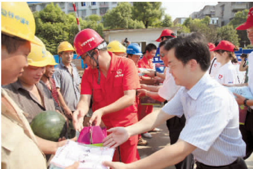
营盘路湘江隧道，志愿者们把毛巾、西瓜、凉茶等爱心物资送到工人手中。