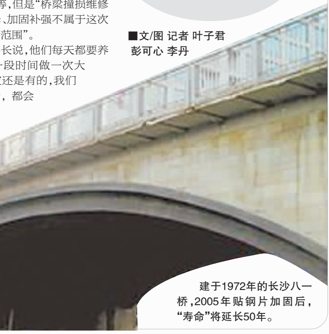
建于1972年的长沙八一桥,2005年贴钢片加固后,“寿命”将延长50年。