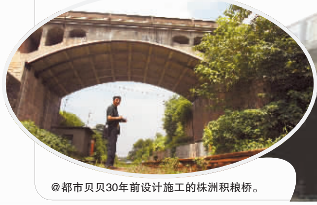
@都市贝贝30年前设计施工的株洲积粮桥。