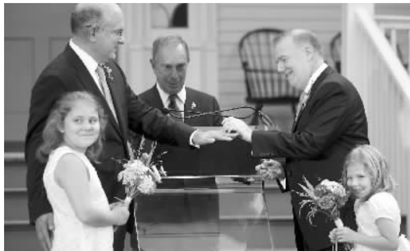
7月24日,在美国纽约市长官邸前,市长首席顾问范恩布莱特(右)为纽约市议会消费者事务委员会委员明茨(左)戴上婚戒。纽约市长布隆伯格主持了婚礼。

据悉,163医院根据国家规定“三甲医院全面推广免费实名预约挂号服务”,开通了电话预约挂号服务。医院皮肤科专家预约挂号电话:0731-88850608。