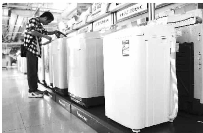
今年上半年家用电器、日用百货的质量和售后服务仍然是投诉大户。

岳阳市开发区工商分局八字门工商所接报后,12315工作人员马上与消费者取得了联系,了解情况属实,与消费者到