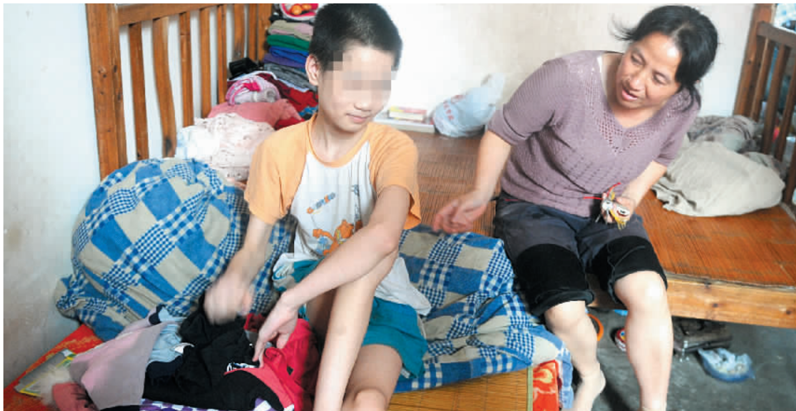
7月12日,长沙市咸嘉花园小区,果果的姨妈肖女士和果果聊天,劝说他下楼走走,被他拒绝。