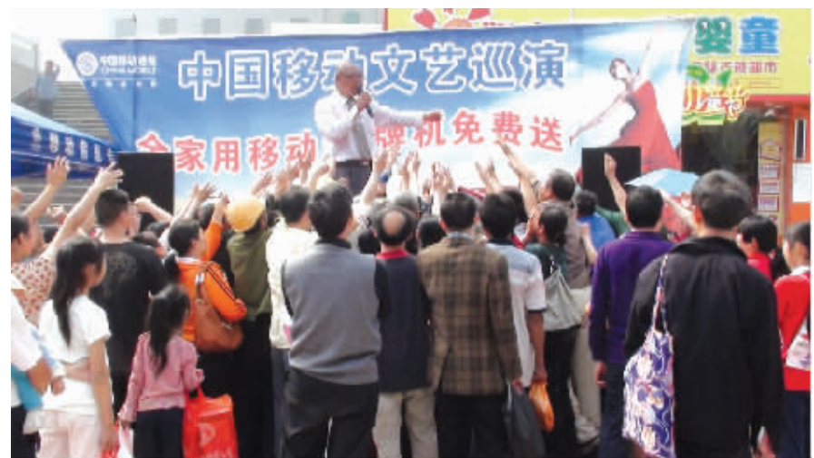
日前,怀化江洪移动开展爱心机专场促销活动。由于事先将机卡绑定,客户购机后到渠道网点登记资料就可使用,从购买到开机通话,全程不超过一分钟,方便快捷又实惠,吸引了众多中老年朋友抢购。