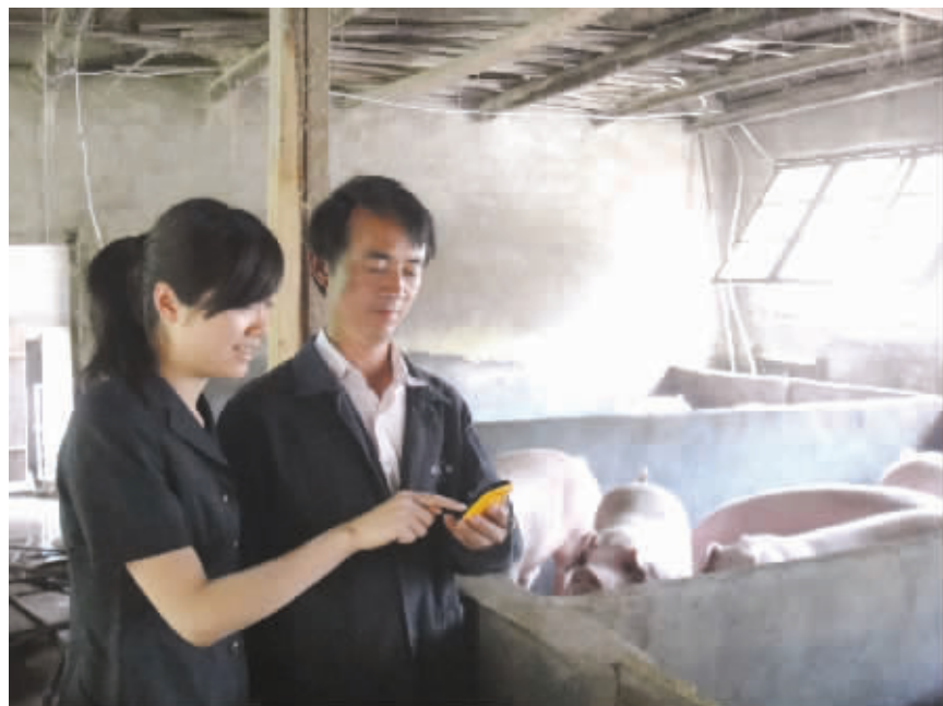
湖南移动为更好地帮助农户建立产销渠道,拓宽销路,促进农户快速致富,组织客户经理深入广大农村进行信化指导工作。图为株洲醴陵移动客户经理在洪源猪场指导养殖户使用供销通业务。