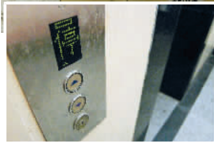
◀3号楼的一个电梯已经暂停使用。