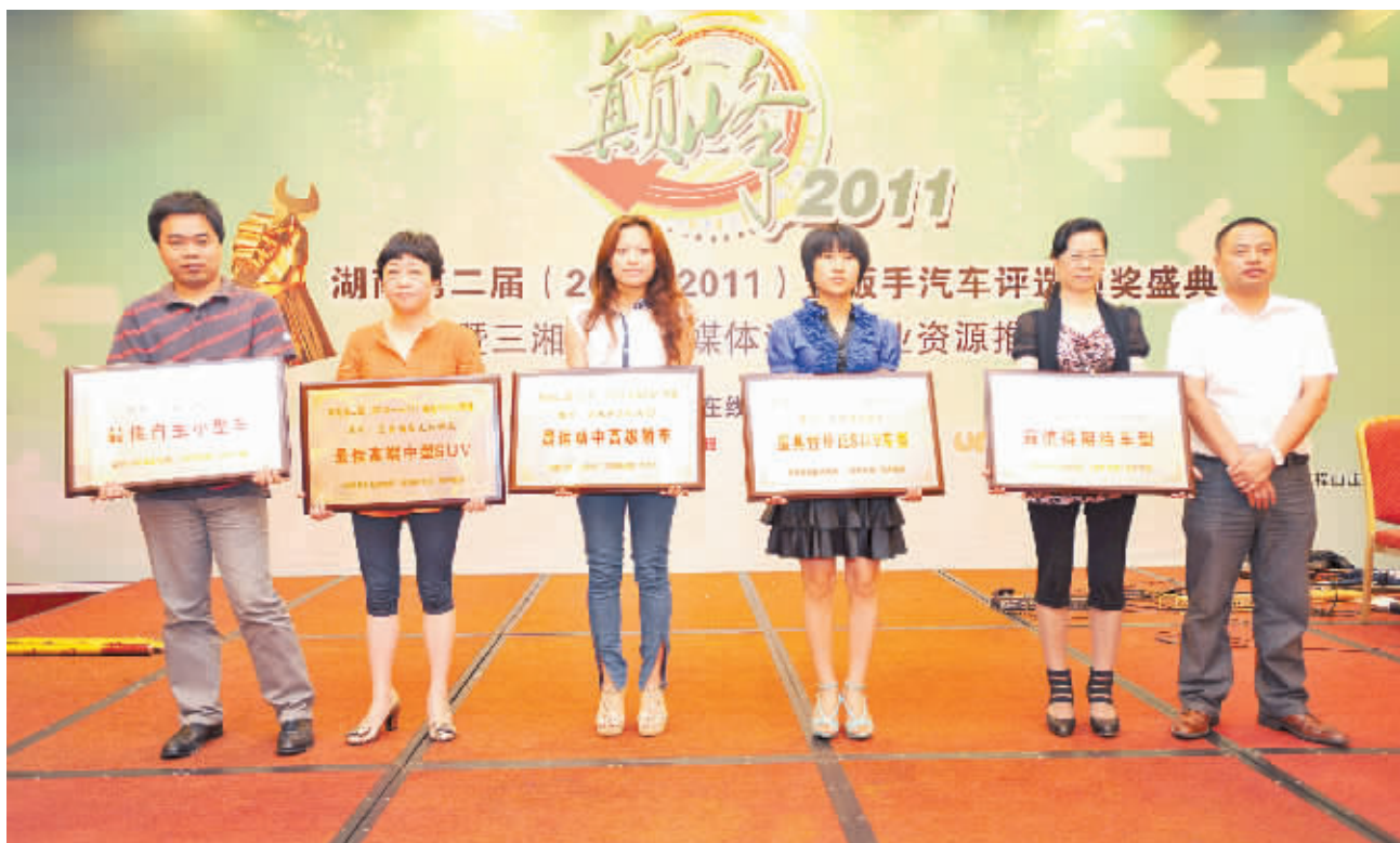
第二届湖南金扳手颁奖现场。

没有调查，就没有发言权。作为湖南首个综合了专家评议、车主反馈、权威数据、网友互动等诸多元素的大型本土汽