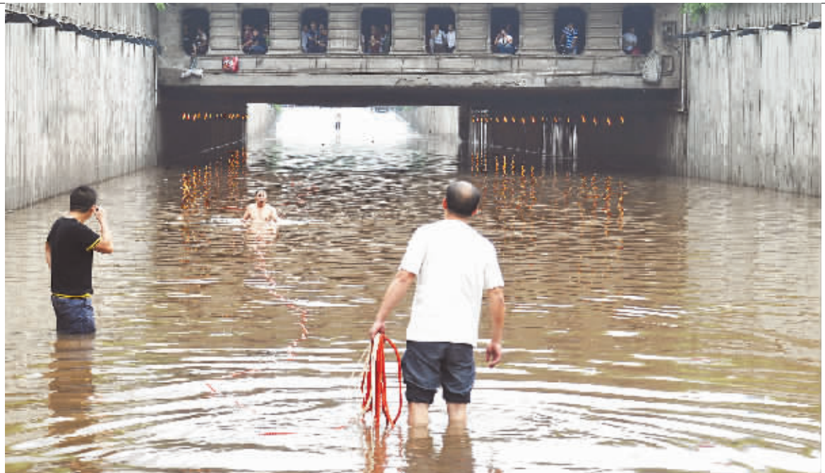
6月28日,长沙市五一大道与芙蓉路交会的立交桥下积水严重,市民正在试图打捞水下的车辆。