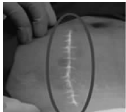
传统手术:十几厘米大拉链

据悉,为了向三湘女性推广和普及微创手术,改变百姓对微创妇科认识方面的旧有错误观念,同时解决看病难、看病贵的医疗现状,湖南省红十字妇幼医院特开展“微创妇科手术普及推广季”活动。该活动截止日期为8月31日,活动内容丰富,其中微创技术治疗不孕不育最高援助2000元,宫颈疾病微创术最高援助500元,无痛人流微创术援助300元,妇科肿瘤微创术包干6500元,宫外孕微创术包干6000元,详情可拨打0731-85421555进行咨询和预约。