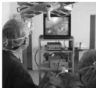
微创手术:高清可视操作