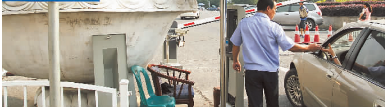
6月21日,长沙市新世纪体育文化广场的收费停车场已设立近2个月。