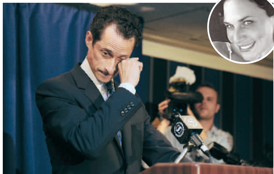
在本周一, 安东尼·维纳声泪俱下地承认确实与互联网的诸多女性维持着不正当的关系。他表示, 目前对于自己的所作所为懊恼不已, 但同时表示, 不愿意辞职。