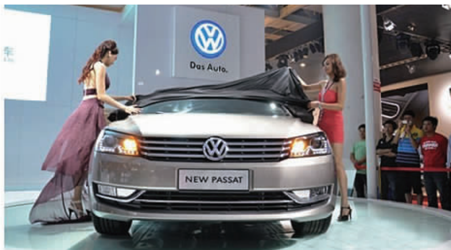
全新帕萨特在2011年湖南车展上上市。