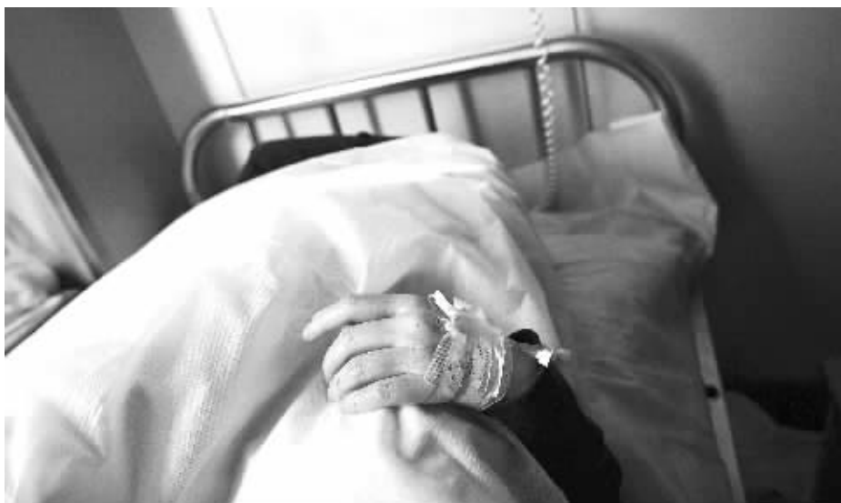
5月24日,省脑科医院急诊室,车祸中受伤的罗女士正在接受治疗。