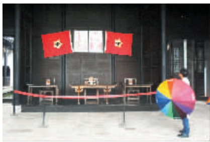
1927年11月28日，湘赣边界的第一个红色政权——茶陵县工农兵政府正式建立。