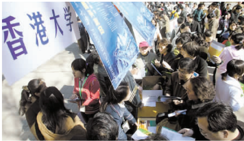
以往在香港高校中流行的“收取留位费”今年被明令禁止。

据了解,今年香港地区12所高校预计在内地招生1800人,澳门地区5所高校计划在内地招收1600名本科生。与去年相比,部分高校在内地招生的计划数量有所提高,学费也有所上涨。根据时间安排,目前考生正处于报名申请的火热阶段,6月下旬至7月上旬,港澳高校自主招生将迎来面试的高峰。