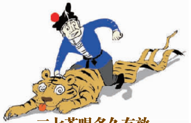
三七茶喝多久有效