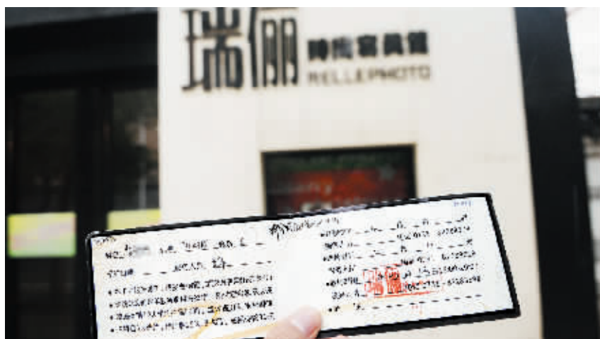
3月21日,长沙市晓园路,瑞丽写真馆的服务卡上写着取件时间3月13日。