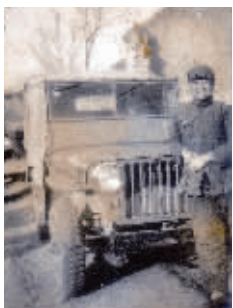
陈赓在解放战争时期。

据《文史春秋》2010年第四期介绍,中共特科成立最早的酝酿是在廖仲恺遇刺事件之后。1925年8月20日,国民党左派领袖廖仲恺在广州中央党部门口遇刺身亡,敲响了中共中央保卫工作的警钟。尤其是亲自参与处理事件的周恩来,更意识到情报保卫工作的重要性,并发现能征善战的陈赓是个从事情报保卫工作的人才。苏策、马京生撰写的《陈赓传》中写道,廖仲恺遇刺后,“周恩来带着陈赓立即赶到现场。陈赓指挥自己的连队,在现场和周围街道作了详细的搜查,加上访问、追踪种种努力,终于抓住了主凶之一的林直勉,摸到了头绪……他提供给周恩来的材料丰富而翔实。周恩来看着这些材料,扬起浓眉高兴地说:‘嘿,我看你能成为中国的契卡’。”