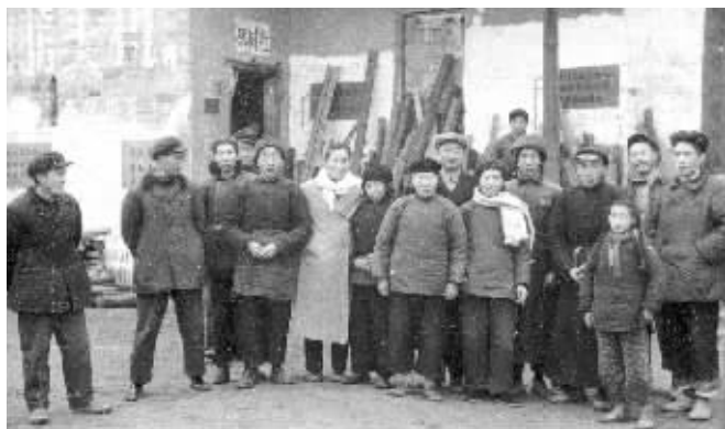
上世纪60年代初,陈赓与夫人傅涯回湘乡老家看望乡亲。