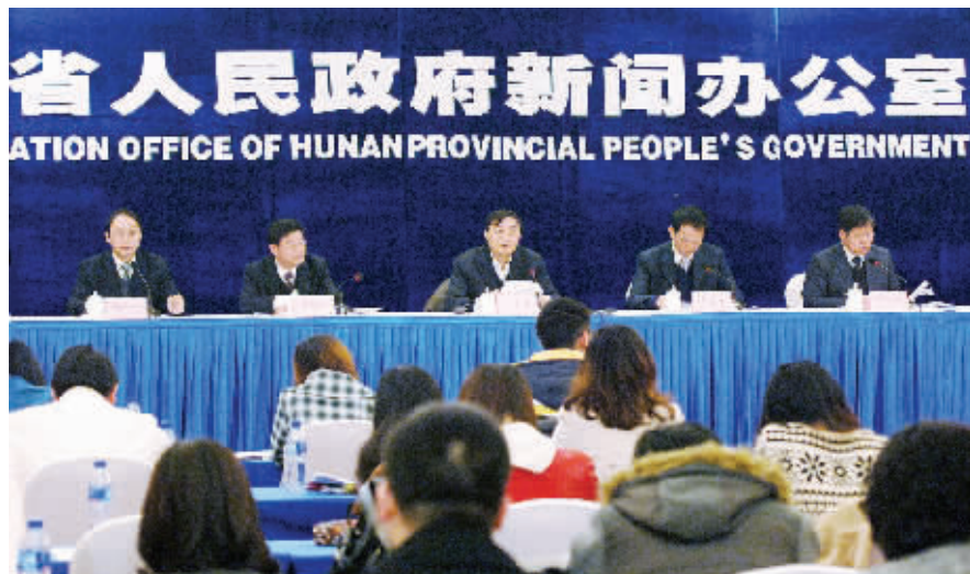
2月23日，贯彻落实中央和省委1号文件新闻发布会在长沙举行。图为发布会现场。