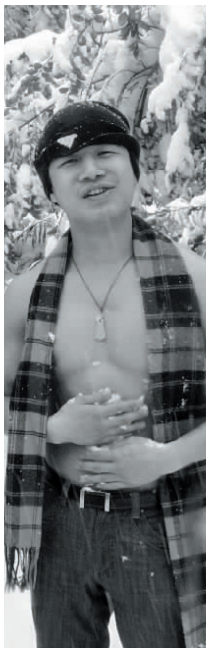
驴友“拾荒”大胆雪浴。