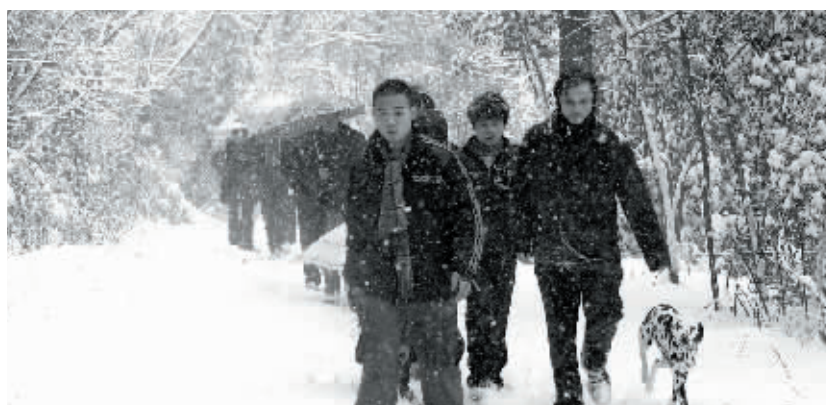
市民纷纷登上岳麓山顶赏雪。

40年一遇的大雪将星城装扮成了一片银色世界,也将市民赏雪的胃口撩拨到了极致,岳麓山当仁不让地成为了他们最理想的去处。19日,三湘好玩俱乐部率一群驴友进山探路,为想去岳麓山踏雪的朋友们带来踏雪攻略。这部岳麓山踏雪攻略将为大家解决两个问题:在哪里看雪?需要注意些什么?