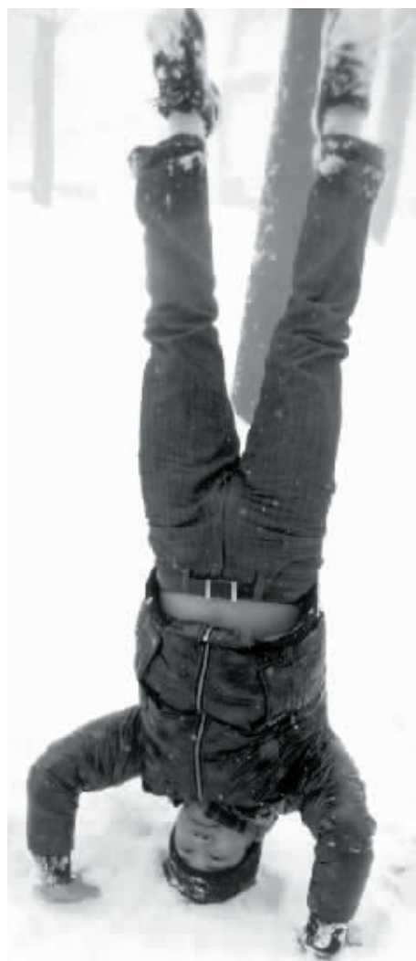
驴友在山顶玩起了倒立。