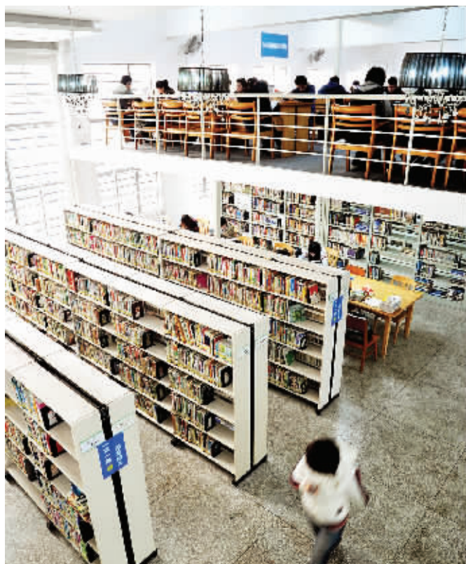
湖南省图书馆内,读书氛围浓厚。