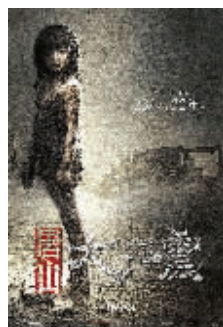
《唐山大地震》海报及剧照(下)。