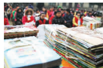
26日，在湘乡市金石镇龙潭小学举行的图书捐赠仪式。

爱心行动仍在延续，如果你也想加入我们的爱心团队，请加入我们的公益QQ群：76313186。