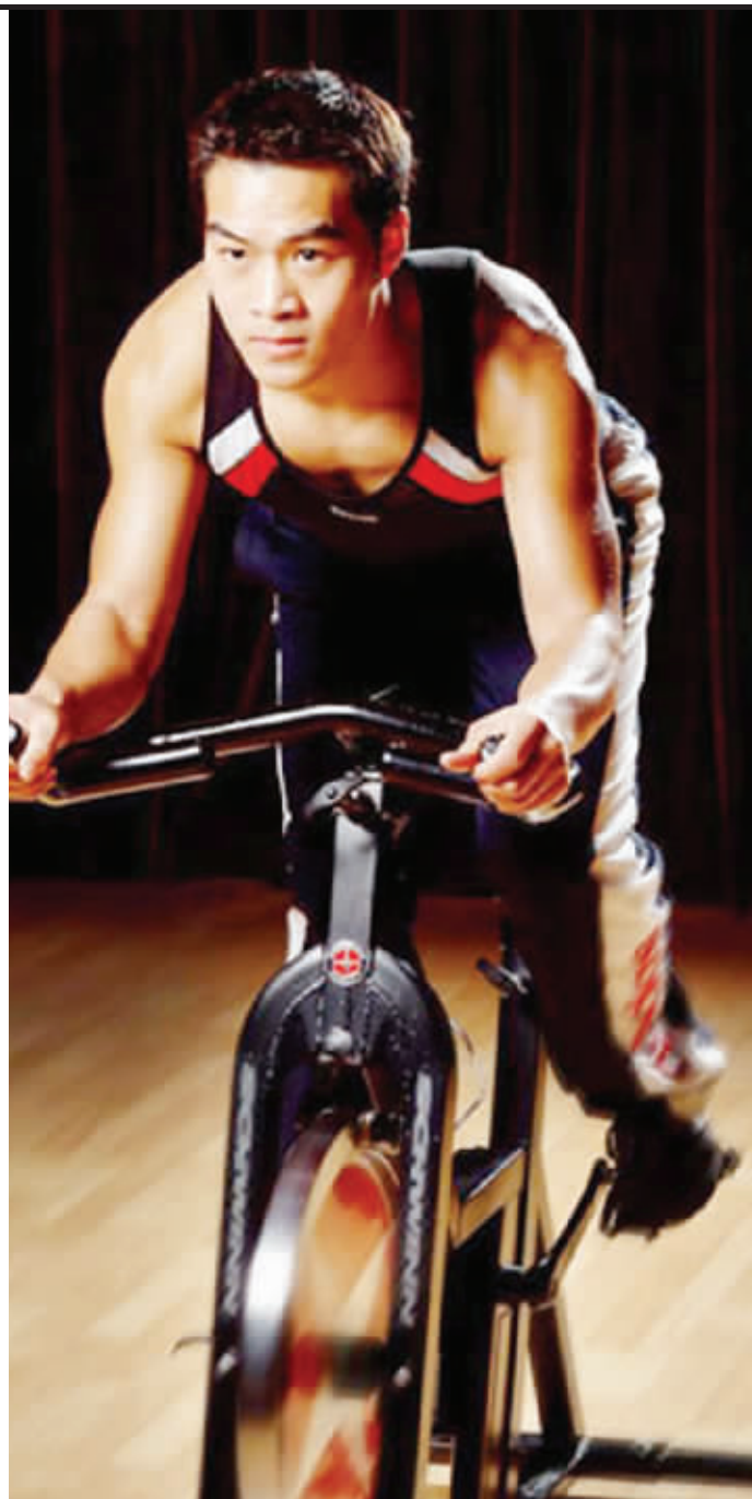
动感单车是不错的冬季室内项目。