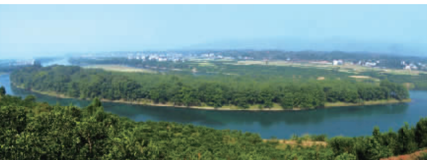
青山秀水梦绿洲,节能环保新生活。