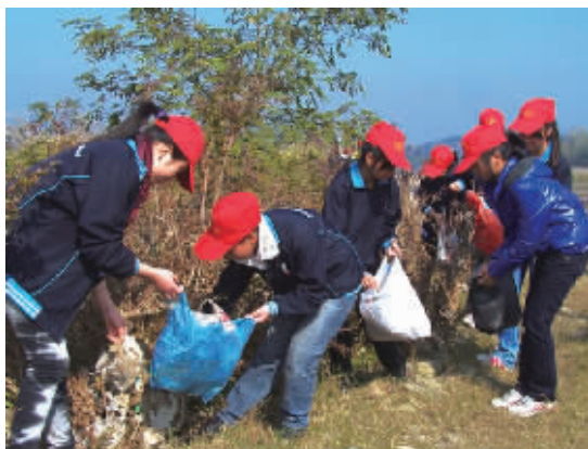
岸边肆无忌惮的垃圾,与我们至爱的母亲河格格不入。我们多走几步路,就能让这些孩子少弯几个腰。