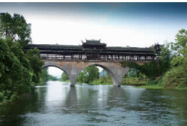
湖南永州东安紫溪镇花桥,静静地躺在流水之上,以天空作伴,以绿叶为伴。