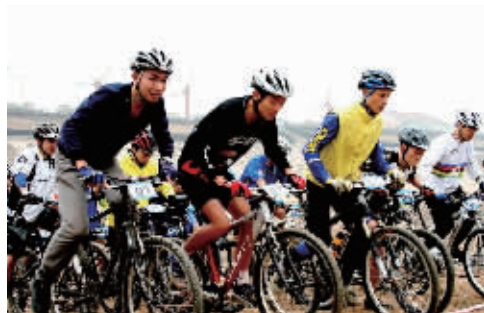
走,骑车一起旅行去。