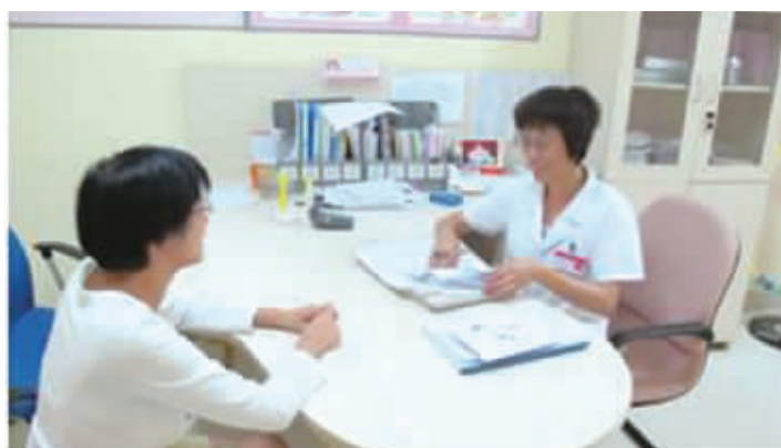
长沙丽人妇产医院医生认真问诊

“纵观整个湖南，终止妊娠行业长期以来始终没有一个规范的行业标准，一些缺乏责任心的黑诊所和不具备资质的医疗机构在技术水平不高、操作不规范、手术环境简陋等情况下进行手术操作，