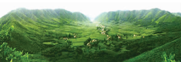
位于辽宁省的岫岩陨石撞击坑全景。