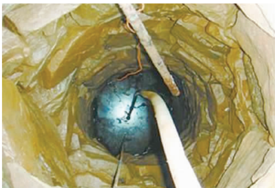
当地村民挖掘的这口井,水上漂着一层油,让陨石坑显得更神秘。

中国领土上这类独特地质构造形迹的空白。这项研究的进展,体现了我国在陨石坑和冲击变质领域的进步,与国际上该科学领域研究水平差距的缩小。