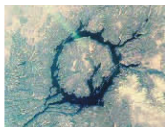
地球十大陨石坑之加拿大曼尼古根陨石坑。