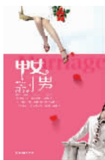
《甲女丁男》 夏景 北京燕山出版社