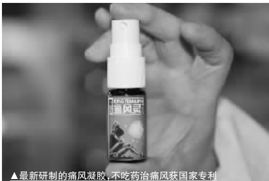
最新研制的痛风凝胶，不吃药治痛风获国家专利

我市东塘楚仁堂大药房、芙蓉区：火车站阿波罗药柜、誉湘大药房、火星镇楚济堂、车站楚明堂药房、天心区：平和堂(五一店/东塘店)、南门口好又多药柜、雨花区：红星步步高超市药柜、岳麓区：河西通程新一佳药号、西站康寿大药房、开福区：东风路楚仁堂药房、星沙：旺鑫大药房、浏阳：钰华堂大药房、望城：工