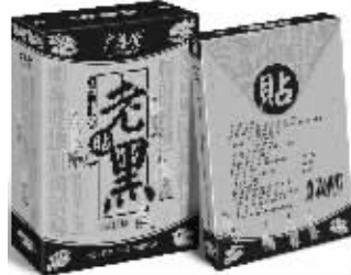
20盒一疗程 市内免费送货