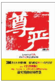
《尊严》 酒中人 新世界出版社

跑到肖庆水跟前，哈着腰说自己还有点急事要处理，廖书记先送肖书记回去，他随后就到。肖庆水随后被肖会水和廖海荣簇拥到了下榻的酒店。肖会水瞥一眼廖海荣，知道他这会儿一定还要跟肖庆水谈一些酒桌上不便说的事，如果自己继续待下去，就显得没眼色了。于是微笑着对肖庆水说：“肖书记，你们聊，我还有点事。”肖庆水默默地点了点头，并没起身。这时，廖海荣站起来，从脸上挤出一丝微笑，走到肖会水跟前，关切地说：“会水，这一段时间辛苦你了！早点休息吧！”肖会水知道廖海荣这一亲昵的动作是特意做给肖庆水看的。（1）