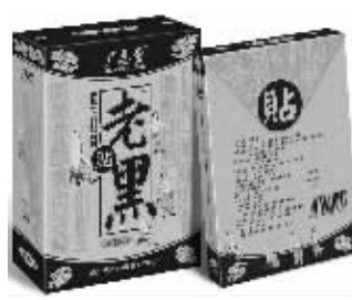
20盒一疗程 市内免费送货

广恩堂【老黑贴】 原价：39元/贴 现价： 12.8元/贴 适用于： 颈椎病、肩周炎、关节炎、风湿类风湿、腰椎间盘突出、骨质增生、骨刺、坐骨神经痛、股骨头坏死、骨质疏松等 买10送3 买20送10 买30送20