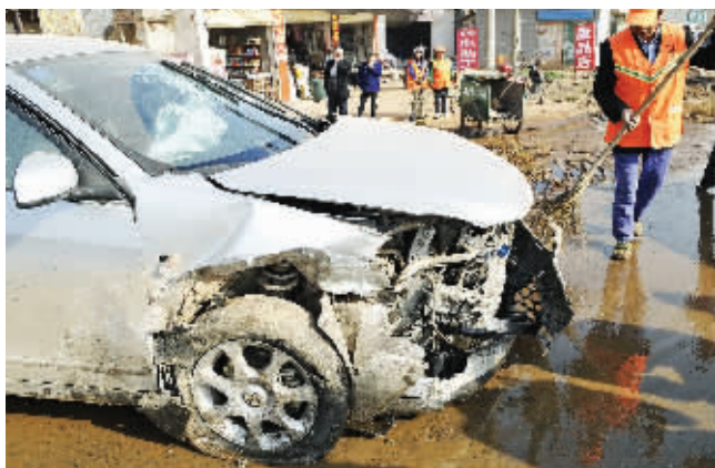
12月8日上午,长沙市香樟东路,被撞的尼桑轿车前端受损严重,地上全是油渍。

长沙市民唐先生12月8日上午9:20来电:香樟东路3车相撞,有辆的士的司机和乘客被卡在车子里面出不来,消防队员已经来了。