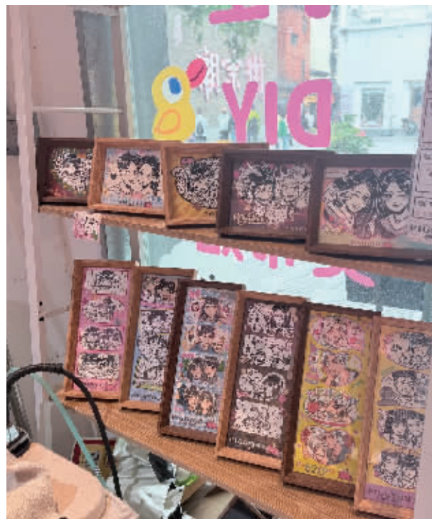
“人生四格”漫画形式多样，颇受欢迎。