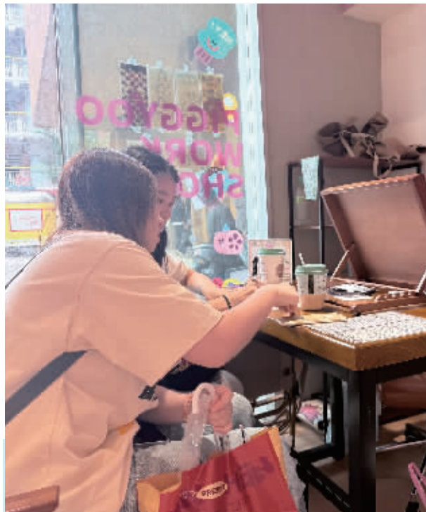
消费者正在手绘店内填写心愿单。