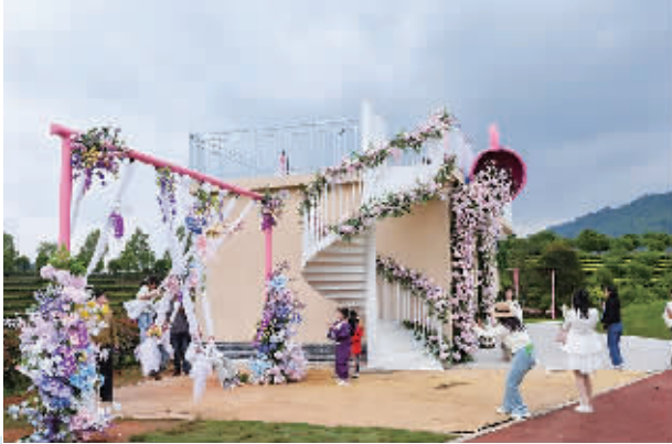
益阳市安化县茶乡花海景区。