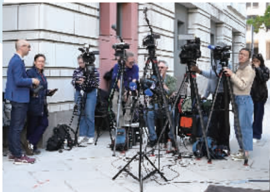
4月27日，华盛顿，媒体记者在美国哥伦比亚特区联邦地区法院附近守候。