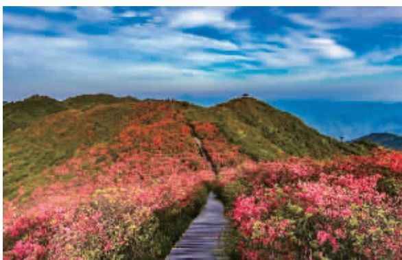
浏阳大围山十万亩杜鹃花。

与此同时，城市里的花事也未落幕。湖南省植物园内，约7800平方米的玫瑰园即将进入盛花期。140多个品种、3万余株玫瑰与月季竞相开放，藤本月季沿廊架倾泻而下，形成色彩斑斓的“花瀑”，成为市民游客打卡的热门点位。