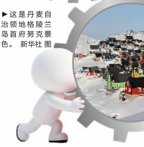
►这是丹麦自治领地格陵兰岛首府努克景色。