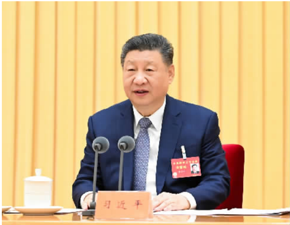
12月10日至11日，中央经济工作会议在北京举行。中共中央总书记、国家主席、中央军委主席习近平出席会议并发表重要讲话。

习近平在重要讲话中总结2025年经济工作，分析当前经济形势，部署2026年经济工作。李强作总结讲话，对贯彻落实习近平总书记重要讲话精神、做好明年经济工作提出要求。 会议指出，今年是很不平凡的一年。以习近平同志为核心的党中央团结带领全党全国各族人民迎难而上、奋力拼搏，坚定不移贯彻新发展理念、推动高质量发展，统筹国内国际两个大局，实施更加积极有为的宏观政策，经济社会发展主要目标将顺利完成。我国经济顶压前行、向新向优发展，现代化产业体系建设持续推进，改革开放迈出新步伐，重点领域风险化解取得积极进展，民生保障更加有力。过去5年，我们有效应对各种冲击挑战，推动党和国家事业取得新的重大成就，“十四五”即将圆满收官，第二个百年奋斗目标新征程实现良好开局。 会议认为，通过实践，我们对做好新形势下经济工作又有了新的认识和体会：必须充分挖掘经济潜能，必须坚持政策支持和改革创新并举，必须做到既“放得活”又“管得好”，必须坚持投资于物和投资于人紧密结合，必须以苦练内功来应对外部挑战。 会议指出，我国经济发展中老问题、新挑战仍然不少，外部环境变化影响加深，国内供需矛盾突出，重点领域风险隐患较多。这些大多是发展中、转型中的问题，经过努力是可以解决的，我国经济长期向好的支撑条件和基本趋势没有改变。要坚定信心、用好优势、应对挑战，不断巩固拓展经济稳中向好势头。 会议强调，做好明年经济工作，要以习近平新时代中国特色社会主义思想为指导，深入贯彻党的二十大和二十届历次全会精神，完整准确全面贯彻新发展理念，加快构建新发展格局，着力推动高质量发展，坚持稳中求进工作总基调，更好统筹国内经济工作和国际经贸斗争，更好统筹发展和安全，实施更加积极有为的宏观政策，增强政策前瞻性针对性协同性，持续扩大内需，优化供给，做优增量、盘活存量，因地制宜发展新质生产力，纵深推进全国统一大市场建设，持续防范化解重点领域风险，着力稳就业、稳企业、稳市场、稳预期，推动经济实现质的有效提升和量的合理增长，保持社会和谐稳定，实现“十五五”良好开局。 会议指出，明年经济工作在政策取向上，要坚持稳中求进、提质增效，发挥存量政策和增量政策集成效应，加大逆周期和跨周期调节力度，提升宏观经济治理效能。要继续实施更加积极的财政政策。保持必要的财政赤字、债务总规模和支出总量，加强财政科学管理，优化财政支出结构，规范税收优惠、财政补贴政策。重视解决地方财政困难，兜牢基层“三保”底线。严肃财经纪律，坚持党政机关过紧日子。要继续实施适度宽松的货币政策。把促进经济稳定增长、物价合理回升作为货币政策的重要考量，灵活高效运用降准降息等多种政策工具，保持流动性充裕，畅通货币政策传导机制，引导金融机构加力支持扩大内需、科技创新、中小微企业等重点领域。保持人民币汇率在合理均衡水平上的基本稳定。要增强宏观政策取向一致性和有效性。将各类经济政策和非经济政策、存量政策和增量政策纳入宏观政策取向一致性评估。健全预期管理机制，提振社会信心。 会议确定，明年经济工作抓好以下重点任务。 一是坚持内需主导，建设强大国内市场。深入实施提振消费专项行动，制定实施城乡居民增收计划。扩大优质商品和服务供给。优化“两新”政策实施。清理消费领域不合理限制措施，释放服务消费潜力。推动投资止跌回稳，适当增加中央预算内投资规模，优化实施“两重”项目，优化地方政府专项债券用途管理，继续发挥新型政策性金融工具作用，有效激发民间投资活力。高质量推进城市更新。