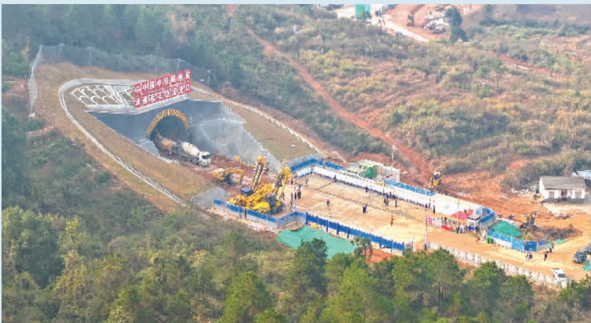
长沙高铁至赣州 最快将1.5小时直达 12月8日，长沙至赣州高铁(简称长赣高铁)江西段首座隧道莲花隧道正式开工，标志着长赣高铁江西段进入全面建设阶段。 长赣高铁建成通车后，长沙至赣州的列车运行时间将由现在的约4小时压缩至最快1.5小时。