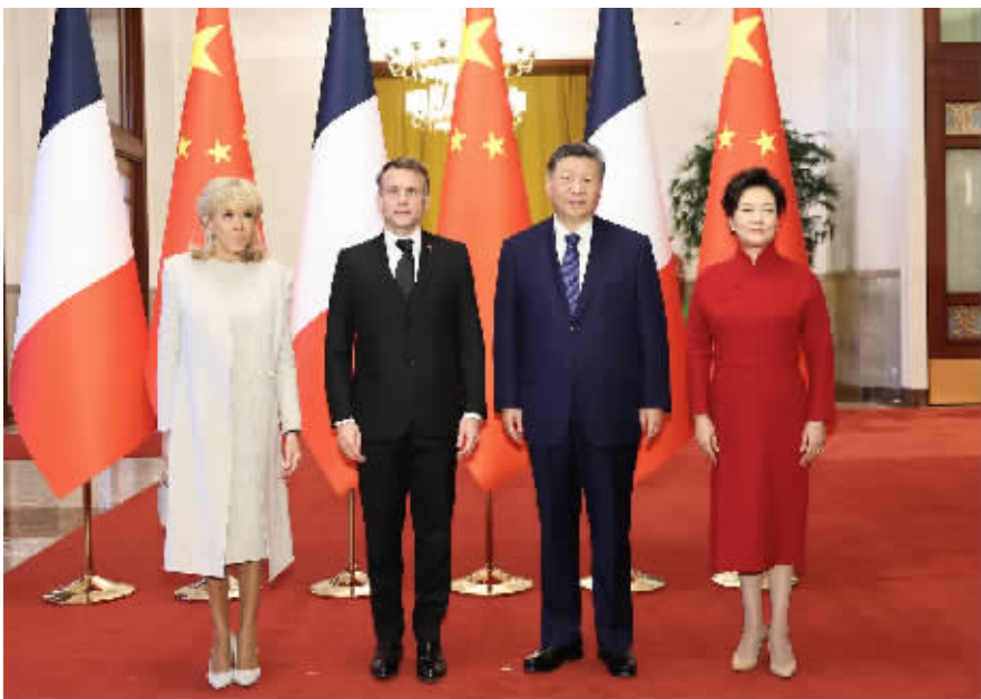
12月4日上午,国家主席习近平在北京人民大会堂同来华进行国事访问的法国总统马克龙举行会谈。这是会谈前,习近平和夫人彭丽媛同马克龙总统夫妇合影。

习近平强调,无论外部环境如何变化,中法两国都应当始终展现大国的战略眼光和独立自主,在彼此核心利益和重大关切问题上相互理解和支持,维护好中法关系的政治基础。中共二十届四中全会审议通过“十五五”规划建议,为未来5年中国发展擘画蓝图,也向世界提供了一份“机遇清单”。中法两国要抓住机遇,拓展合作空间,巩固航空、航天、核能等传统领域合作,挖掘绿色经济、数字经济、生物医药、人工智能、新能源等领域合作潜力。中方愿进口更多法国优质产品,欢迎更多法国企业来华发展,也希望法方为中国企业提供公平环境和稳定预期。中法两国人民有着天然亲近感,要深化文化、教育、科技、地方等领域交流合作,续写人文交流精彩篇章。 习近平强调,当今世界很不太平,热点问题多点爆发、复杂难解。中法同为联合国创始成员国和安理会常任理事国,应当践行真正的多边主义,维护以联合国为核心的国际体系和以国际法为基础的国际秩序,就政治解决争端、促进世界和平稳定加强沟通和协作,推动改革完善全球治理。当前,世界存在南北发展不平衡、发展中国家在国际金融机构中代表性不足等很多不平衡问题,各国应当共担责任、协调行动,携手推动全球经济治理更加公平、公正、合理。中欧50年来的交往合作互利共赢、成就彼此。各国产供应链深度互嵌,开放合作带来机遇发展,“脱钩断链”意味着自我封闭。保护主义不能解决世界产业结构调整的问题,反而将恶化国际贸易环境。中欧双方应该坚持伙伴关系定位,秉持开放态度推进合作,确保中欧关系沿着独立自主、合作共赢的正确轨道发展。 马克龙表示,法中保持密切高层交往,始终相互信任、相互尊重。法方重视对华关系,坚定奉行一个中国政策,愿持续深化法中全面战略伙伴关系。法方乐见中国经济蓬勃发展,坚持开放合作,为世界带来更多机遇,愿同中方促进相互投资,加强经贸、可再生能源等领域合作,促进友好文化交流。法方欢迎中国企业更多赴法投资,愿提供公平、非歧视营商环境。法方致力于推动欧中关系健康稳定发展,认为欧中应坚持对话合作,欧洲应实现战略自主。面对世界地缘形势不稳、多边秩序受到冲击,法中合作更显重要,不可或缺。法方完全赞同习近平主席有关改革完善全球治理、推动全球经济更加平衡的意见,愿同中方加强协调,共担大国责任、坚持多边主义,加强在应对气候变化、保护生物多样性、人工智能治理等领域合作,为促进世界和平与繁荣作出贡献。 两国元首就乌克兰危机交换意见。习近平指出,中方支持一切有利于和平的努力,将继续以自己的方式为危机政治解决发挥建设性作用。中方支持欧洲国家发挥应有作用,推动构建均衡、有效、可持续的欧洲安全架构。 会谈后,两国元首共同见证签署核能、农食、教育、生态环境等领域多项合作文件。 两国元首还共同会见了中外记者。 会谈前,习近平和夫人彭丽媛在人民大会堂北大厅为马克龙和夫人布丽吉特举行欢迎仪式。 马克龙抵达时,礼兵列队致敬。两国元首登上检阅台,军乐团奏中法两国国歌,天安门广场鸣放礼炮21响。马克龙在习近平陪同下检阅中国人民解放军仪仗队,并观看分列式。 当天中午,习近平和彭丽媛在人民大会堂金色大厅为马克龙夫妇举行欢迎宴会。 王毅参加上述活动。 ■据新华社