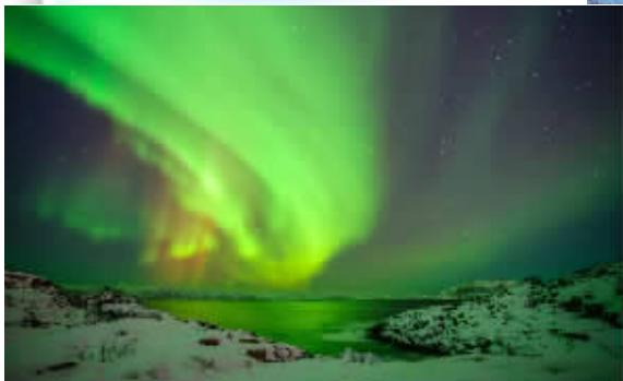
▲俄罗斯捷里别尔卡极光。 ▶俄罗斯网红小镇捷里别尔卡。