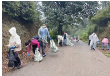
谷山森林环保公益队进行亲子公益活动。