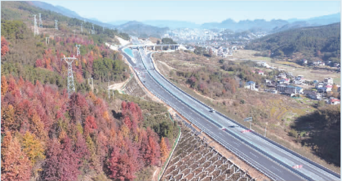
城龙高速冲刺通车 11月29日,城步苗族自治县儒林镇甘溪村,城(步)龙(胜)高速公路进入标线绘制、护栏安装等扫尾工作,将于12月底正式通车运营。

春秋旅游副总经理周卫红对记者表示,目前春秋旅游推出的2026年1~2月及春节假期期间多款冬季限定俄罗斯旅游产品,已然售罄,市场热度可见一斑。 随着此次免签政策正式落地,旅游企业也将进一步加码俄罗斯旅游市场布局。比如春秋旅游计划持续优化产品线路矩阵:一方面计划推出赴俄罗斯火车专列产品;另一方面将开拓更多涵盖俄罗斯远东地区的新兴目的地,丰富游客的出行选择。