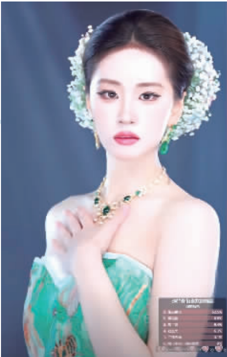
“IPO柳柳”因刘亦菲仿妆火爆全网。