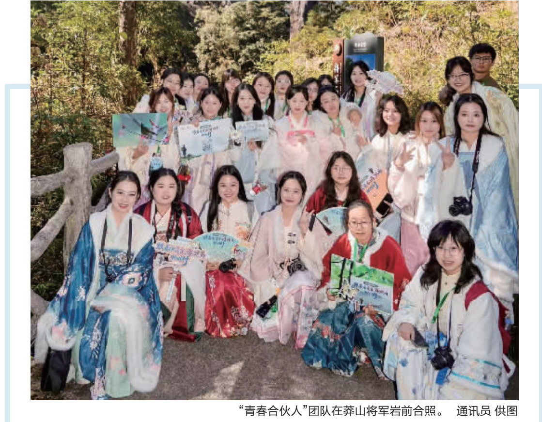
“青春合伙人”团队在莽山将军岩前合照。