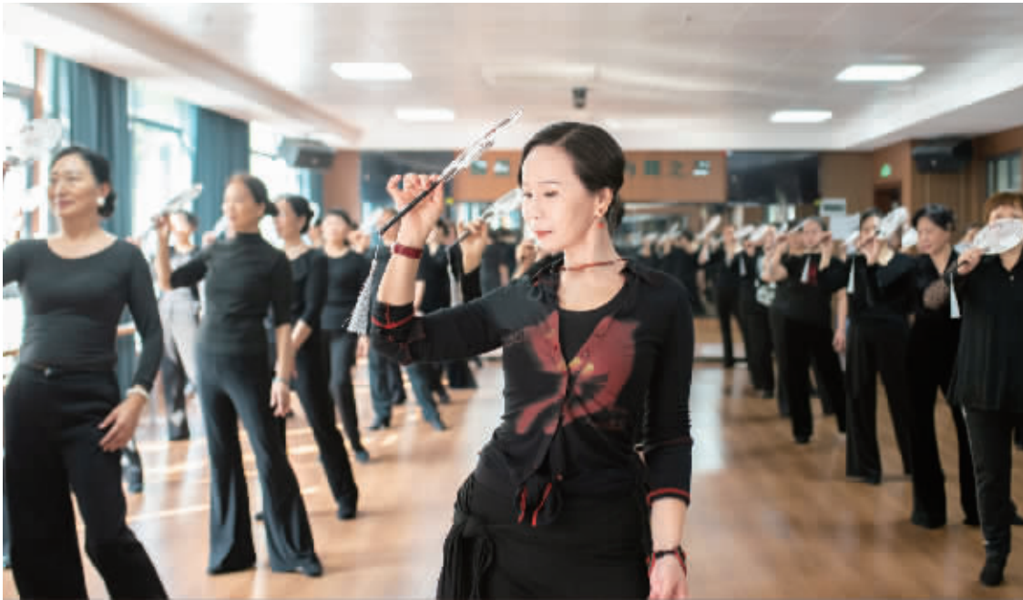
11月24日,娄底市老年大学,学员在学习模特走秀。近年来,学校根据老年人需求优化课程设置,为退休群体提供学习交流的平台,丰富晚年精神文化生活。